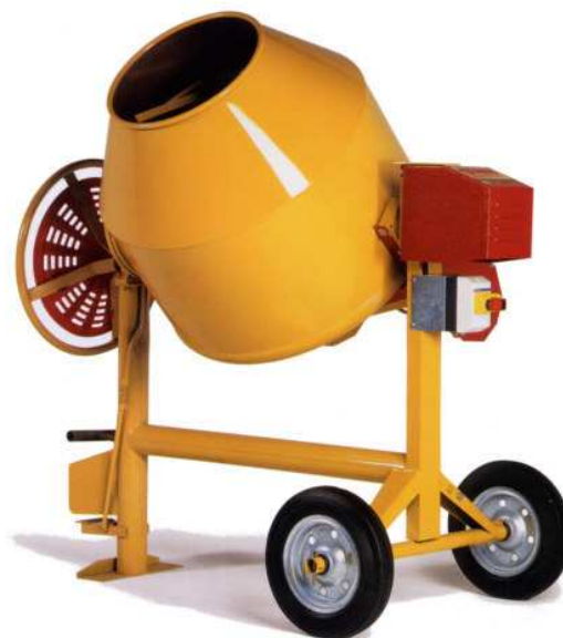
Betoniera Monofase 250 lt 220 V