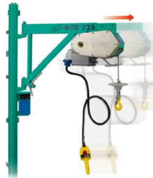
Elevatore Imer monofase TR 225N completo di attacco a ponteggio e pulsantiera